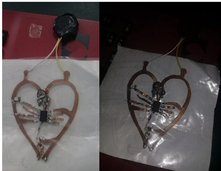
Ilustración 4 Primer prototipo del tatuaje electrónico

El primer prototipo se muestra de la siguiente manera (ilustración 4), colocando los componentes como se muestra en la ilustración anterior (ilustración 3), para el montaje en físico se necesitó tinta conductora y pequeños trozos de cobre, esto con el fin de que las pistas fueran flexibles, pero sin perder la forma del circuito y con mayor conductividad. También se tomó en cuenta que los materiales usados para el montaje del circuito no sean tóxicos para la piel, así como también que las personas a las cuales se les hicieron las pruebas no fueran alérgicas a la tinta conductora.