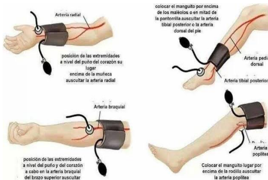
Ilustración 1 Puntos de medición para el ritmo cardiaco (Colima, 2012)

Cuando se inflar el mango del esfigmomanómetro, se genera una “presión externa”, que interrumpe el flujo de sangre en el brazo. (Colima, 2012) En la siguiente ilustración se puede observar los diferentes puntos en los cuales se es capaz de medir el pulso cardiaco. Ilustración 1