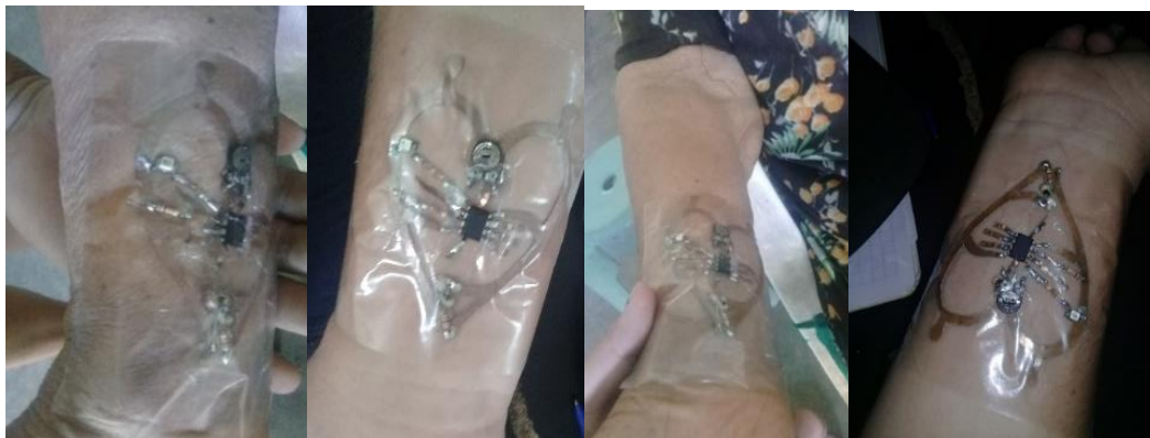
Ilustración 5 Puesta en marcha del tatuaje electrónico

El prototipo cuenta con una pequeña capa de aislante en la parte inferior esto para que no cause daño al usuario y también para que la misma energía del cuerpo no afecte en la lectura. En la siguiente ilustración se muestra el prototipo de tatuaje electrónico ya puesto. (Ilustración 5)