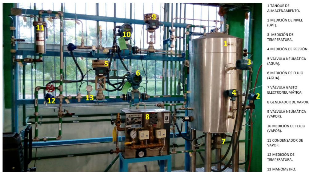
Figura 1. Simulador de procesos industriales.

El laboratorio de Ingeniería Electrónica del Instituto Tecnológico Superior de Pánuco cuenta con un simulador de procesos industriales para la realización de prácticas de laboratorio de las materias de la especialidad en Instrumentación y Control, figura 1.