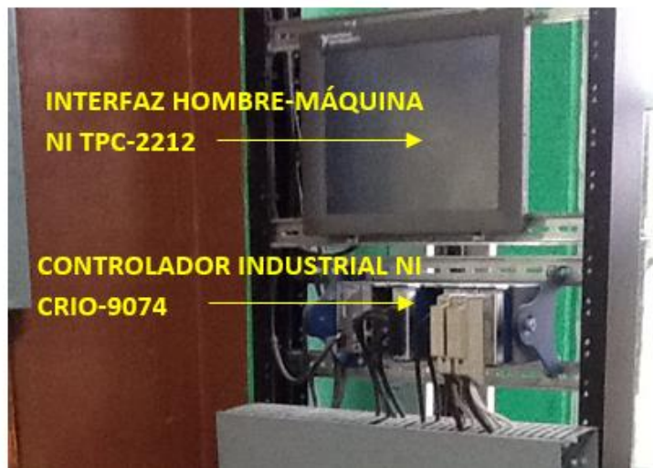
Figura 3. Sistema de control del simulador de procesos industriales.

El control del simulador se realiza a través de un controlador industrial embebido NI (National Instruments) cRIO-9074, figura 3, con monitoreo visual de datos en una interfaz hombre-máquina NI TPC-2212, figura 4, la programación de los algoritmos de control de los procesos que puede simular el equipo se realiza mediante el software de Labview de NI (Cabriales et al., 2015 y Hernández et al. ,2015).